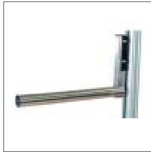
Dorn / Ausleger