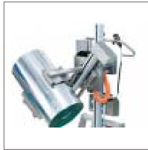
Greifer / Wender