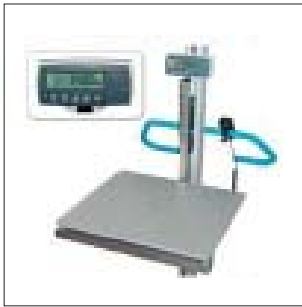
Waage / Zähler